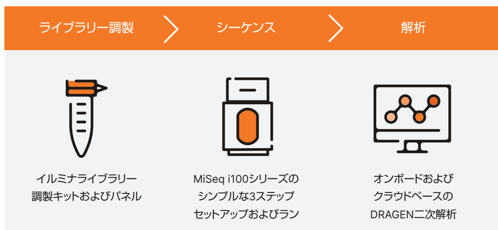
図2: MiSeq i100 および MiSeq i100 Plusシステムは、直感的でシンプルなワークフローを提供し、NGSへの移行を容易にします。