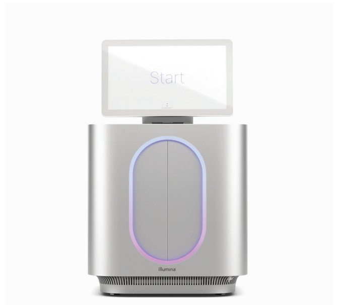
図1: MiSeq i100およびMiSeq i100 Plusシステム: イルミナのイノベーションにより、シンプルさとスピードを追求して設計されたベンチトップ型システムでNGSへのアクセスを拡大し続けます。

イルミナでは、お客様の体験をあらゆるイノベーションの中核に位置付けており、ライブラリー調製、シーケンス、データ解析を可能な限り簡単にすることを目指しています。MiSeq i100シリーズワークフローは、プロジェクトの完了に必要な時間と労力を最小に抑えるためにあらゆる点が最適化されています（図2）。MiSeq i100およびMiSeq i100 Plusシステムは、ランセットアップがわずか3つのステップで20分以内に完了するシンプルなワークフローを提供します。ロードしてランするだけの試薬カートリッジと消耗品は、常温で出荷および保管されるため、シーケンシング前に試薬が融解するのを待つ必要はありません。インフォマティクスが直感的に使えるため、作業は最小限で済み、解析専門のバイオインフォマティシャンに頼らずに済むので、初めての方にも慣れた方にも便利にお使いいただけます。