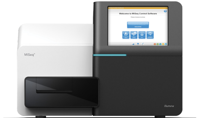
Figura 1: MiSeq System. Il MiSeq System è compatto e consente di eseguire il sequenziamento di nuova generazione in modo rapido e conveniente.

Il MiSeq System offre la prima piattaforma per il sequenziamento dal DNA ai dati che integra in un unico strumento generazione di cluster, amplificazione, sequenziamento e analisi dei dati. L'ingombro ridotto (circa 0,18 metri quadrati) consente di posizionare lo strumento praticamente in qualsiasi ambiente di laboratorio (Figura 1). Il MiSeq System sfrutta la chimica di sequenziamento mediante sintesi (SBS, sequencing by synthesis) di Illumina, una comprovata tecnologia di sequenziamento di nuova generazione (NGS, next-generation sequencing) citata in più di 300.000 pubblicazioni "peer-reviewed", il quintuplo di tutte le altre tecnologie NGS combinate. 1 Grazie all'efficacia della tecnologia NGS fornita in uno strumento compatto, il MiSeq System è la piattaforma ideale per analisi genetiche rapide ed efficaci in termini di costi.