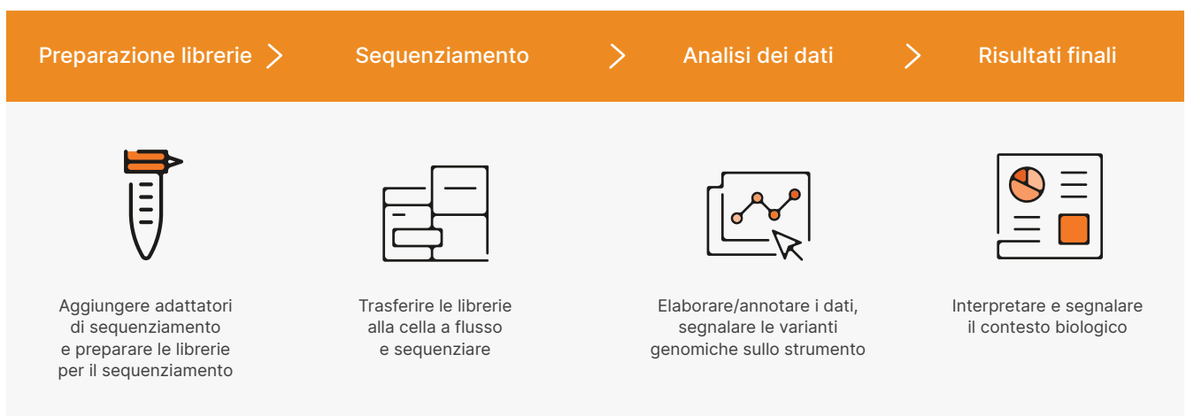
Figura 2: flusso di lavoro del MiSeq System. Il flusso di lavoro ottimizzato del MiSeq System assicura tempi di elaborazione rapidi per il sequenziamento da banco di nuova generazione. Le librerie possono essere preparate con qualsiasi kit di preparazione delle librerie compatibile. Il sequenziamento dura cinque ore e mezza e include: generazione di cluster, sequenziamento e identificazione delle basi qualitativamente valutate con scansione a doppia superficie per una corsa di 2 × 25 coppie di basi su un MiSeq System con il MiSeq Control Software.

di Illumina. BaseSpace Sequence Hub fornisce caricamento dei dati in tempo reale, semplici strumenti di analisi dei dati, monitoraggio della corsa basato su Internet e una soluzione di archiviazione sicura e scalabile. Grazie a una suite di strumenti di analisi dei dati e a una serie crescente di app di analisi di terze parti, i ricercatori possono eseguire tutte le operazioni necessarie. BaseSpace Sequence Hub consente inoltre di condividere i dati con colleghi o clienti in modo facile e veloce.